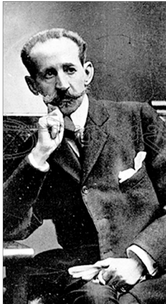
Jacinto Octavio Picón.

En «La amenaza» el mundo burgués en que tan a sus anchas se mueve Picón se cambia en un ambiente proletario. Nos cuenta un accidente en una fábrica, el injusto trato que dan los propietarios al obrero